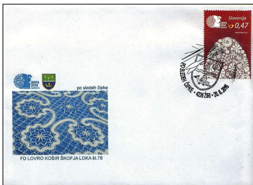
Ovitek Po sledih čipke v Žireh