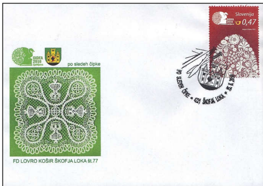
Ovitek Po sledih čipke v Škofji Loki